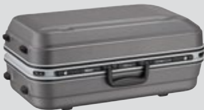
Objektiivilaukku CT-608 (sisältyy toimitukseen)