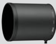
Vastavalosuoja HK-40 (sisältyy toimitukseen)