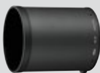
Vastavalosuoja HK-34 (sisältyy toimitukseen)