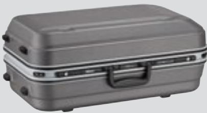
Objektiivilaukku CT-505 (sisältyy toimitukseen)