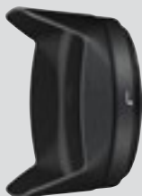
Bajonettikiinniteinen vastavalosuoja HB-75 (vakiovaruste)