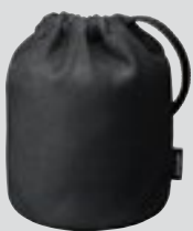
Objektiivilaukku CL-1218 (valinnainen lisävaruste)